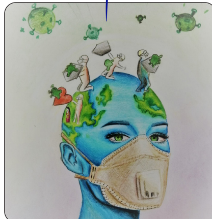
سودا گل محمدی / موسسه آموزش رشديه / شماره اثر ۹۹۰۳۷