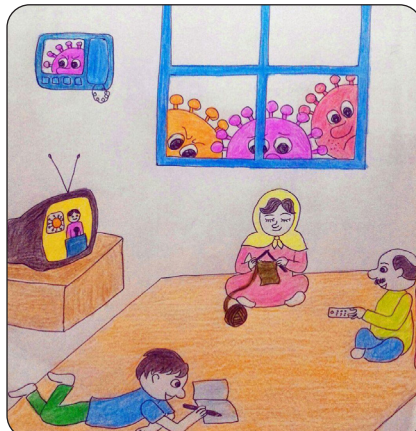
زینب زارع الباتو / دانشگاه علوم پزشکی سبزوار / شماره اثر ۹۹۰۳۸