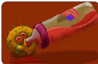
فاطمه حیدری / دانشگاه صنعتی اصفهان / شماره اثر ۹۹۰۳۶